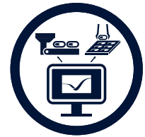
LINE EXECUTION SYSTEM