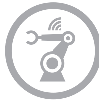
SMART AUTOMOTIVE FACTORY