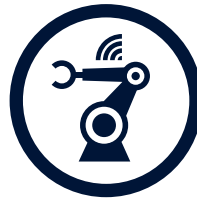
SMART AUTOMOTIVE FACTORY