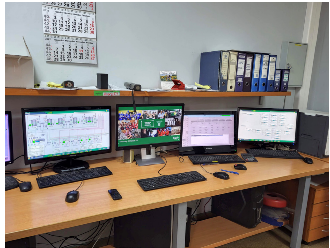
Sistem energetskeg menadžmenta i rashlade.

potpuno osavremenjuje i uvode se najsavremeniji standardi i sertifikati koji su garancija kvaliteta.