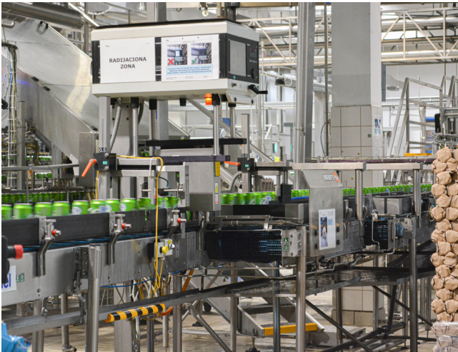
Održivi procesi na liniji za punjenje limenki.