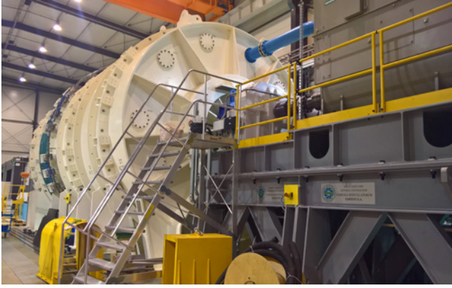
Instytut Lotnictwa의 새 시험 시설은 제트 엔진 팬의 도전적인 시험을 수행합니다.