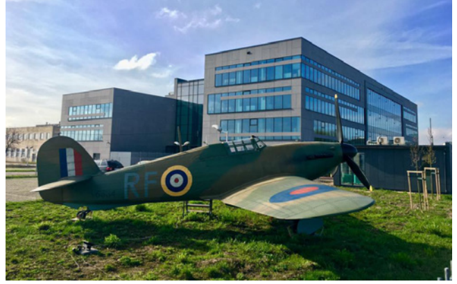
1926년에 설립된 바르샤바 항공 연구소 Instytut Lotnictwa는 오랜 역사를 자랑합니다.

Trend로 증강되어 사용자가 필수 데이터는 물론 시스템에서 동시에 발생하는 많은 현상을 차트와 그래프로 시각화하여 확인할 수 있습니다. 그래프에서 약 1,100개의 서로 다른 변수를 다룰 수 있습니다.